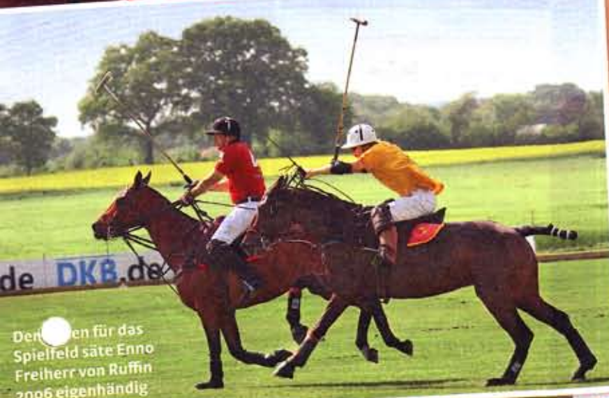
Den Plan für das Spielfeld säte Enno Freiherr von Ruffin 2006 eigenhändig