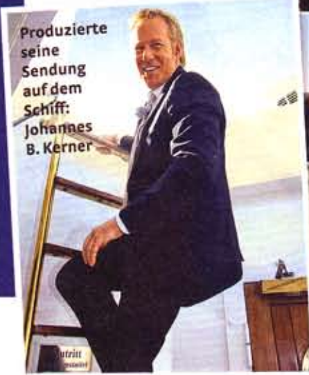
Produzierte seine Sendung auf dem Schiff: Johannes B. Kerner