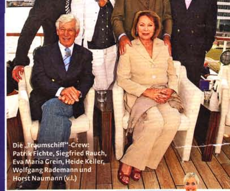
Die „Traumschiff“-Crew: Patrik Fichte, Siegfried Rauch, Eva Maria Grein, Heide Keller, Wolfgang Rademann und Horst Naumann (v.l.)