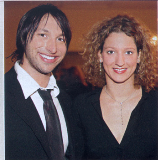
▲ Auch Schwimmstars tummelten sich in St. Moritz: ANTJE BUSCHSCHULTE und IAN THORPE fuhren beim OMEGA-Event wagemutig Bob. Antjes kippte um, aber zum Glück passierte nichts