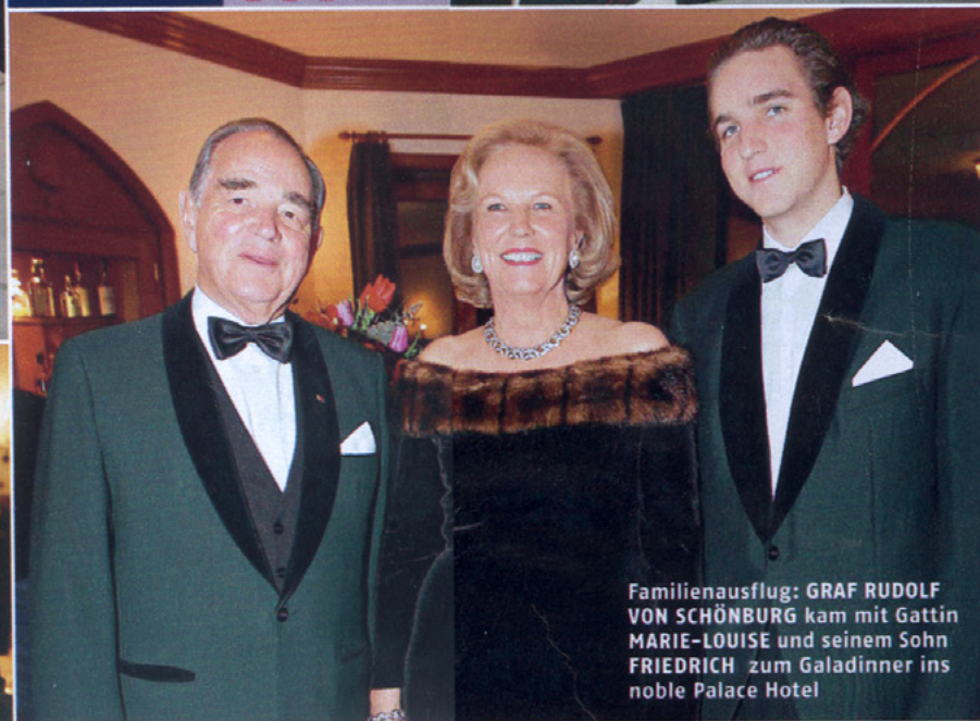
Familienausflug: GRAF RUDOLF VON SCHÖNBURG kam mit Gattin MARIE-LOUISE und seinem Sohn FRIEDRICH zum Galadinner ins noble Palace Hotel